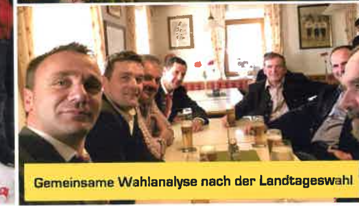
Gemeinsame Wahlanalyse nach der Landtagswahl