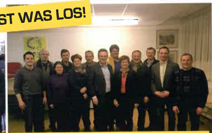
Generalversammlung d. Norischen Region