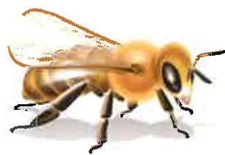
Kärntner Bienen- wirtschaftsgesetz K-BiWG Meldung nach §5 Abs. 2

Meldungen bzw. Nachmeldungen, welche außerhalb der vorgegebenen Frist (15. April) seitens der Bienenhalter einlangen, sind als verspätet anzusehen und erfüllen daher den Straftatbestand des § 17 Abs. 1 lit. B K-BiWG.