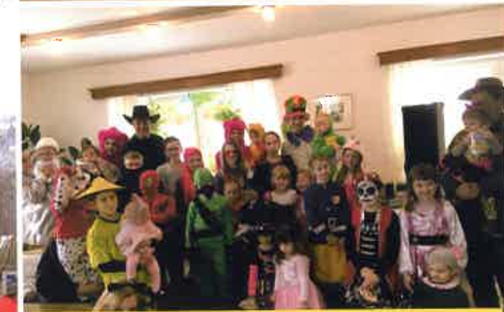
Kinderfasching der Gemeinde Diex im GH Leitgeb