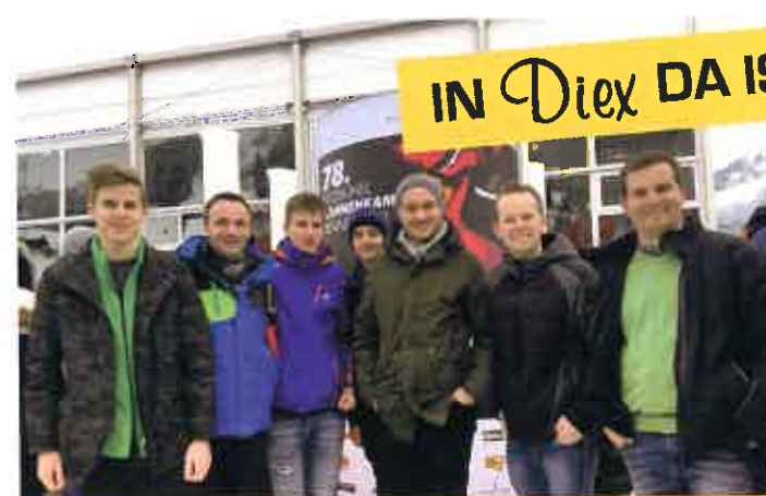
Gemeindeausflug nach Kitzbühel